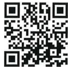
全國有機茶評鑑報名 QR